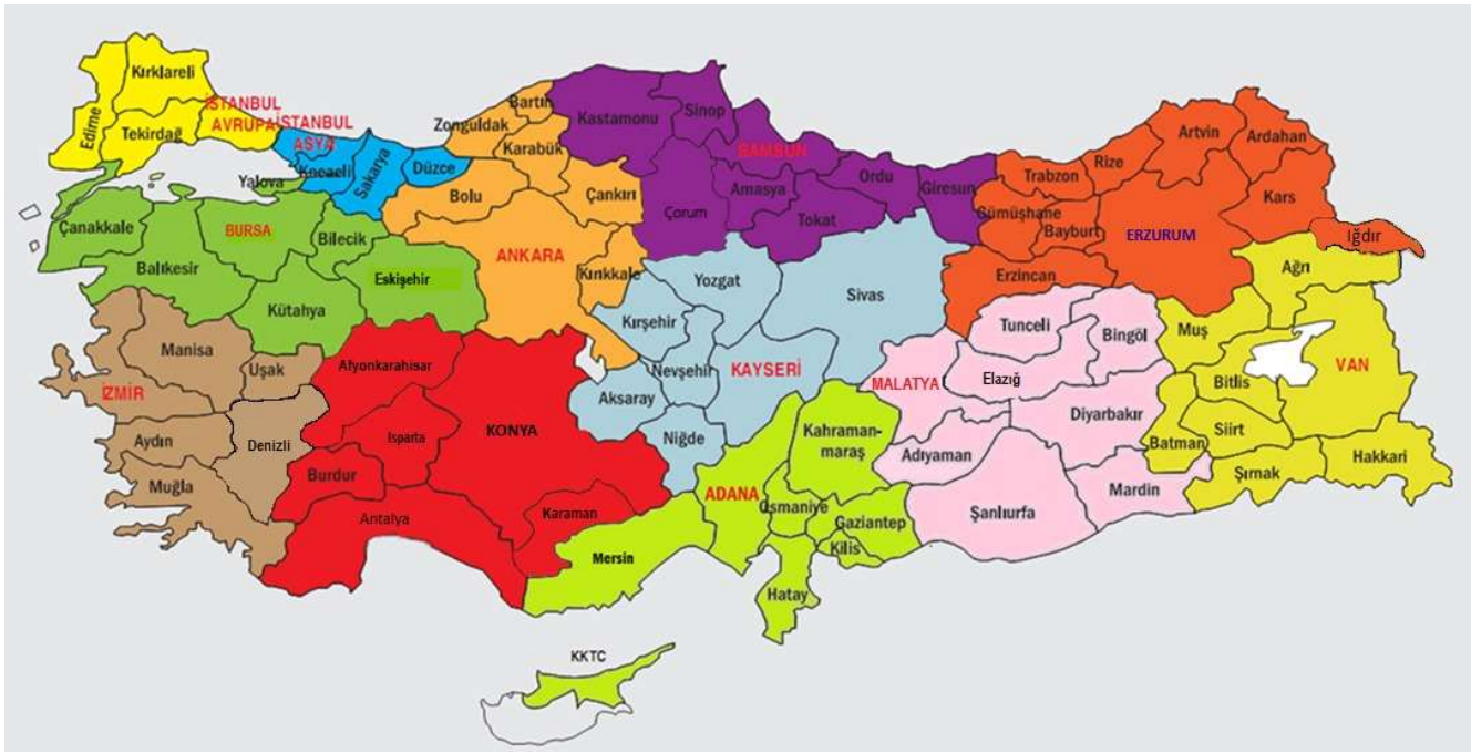
Şekil 1. Yarışma Bölgeleri Haritası

Bu yarışma, Türkiye genelinde 12 bölgede yapılmaktadır. Her bölge için bir il, merkez olarak seçilmiştir. Her bölgenin il merkezinden iki öğretim üyesi, TÜBİTAK tarafından yarışmalardan sorumlu Bölge Koordinatörü ve Bölge Koordinatör Yardımcısı olarak görevlendirilir. Adana, Ankara, Bursa, Erzurum, Konya, İstanbul Asya, İstanbul Avrupa, İzmir, Kayseri, Malatya, Samsun ve Van bölge merkezi illerdir. İllerin bölgelere göre dağılımları Şekil 1'de verilmiştir.