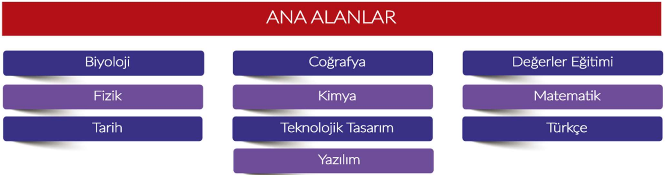
Şekil 2. Ana Alanlar

Yarışma, 10 ana alanda düzenlenmektedir (Şekil 2).