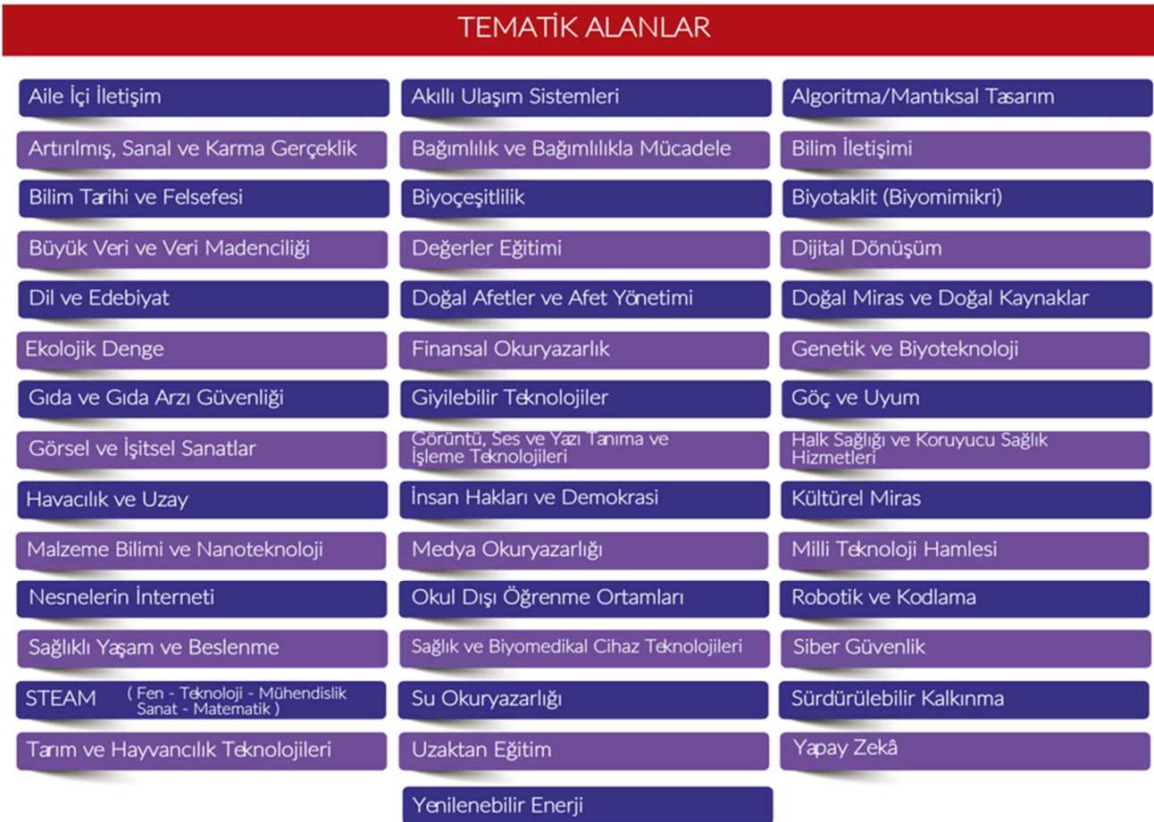
Şekil 3. Tematik Alanlar

Bu ana alanlarda yarışmaya başvuracak projelerin, aşağıda isimleri verilen tematik alanlardan birini kapsayacak şekilde hazırlanmış olması gerekir (Şekil 3).