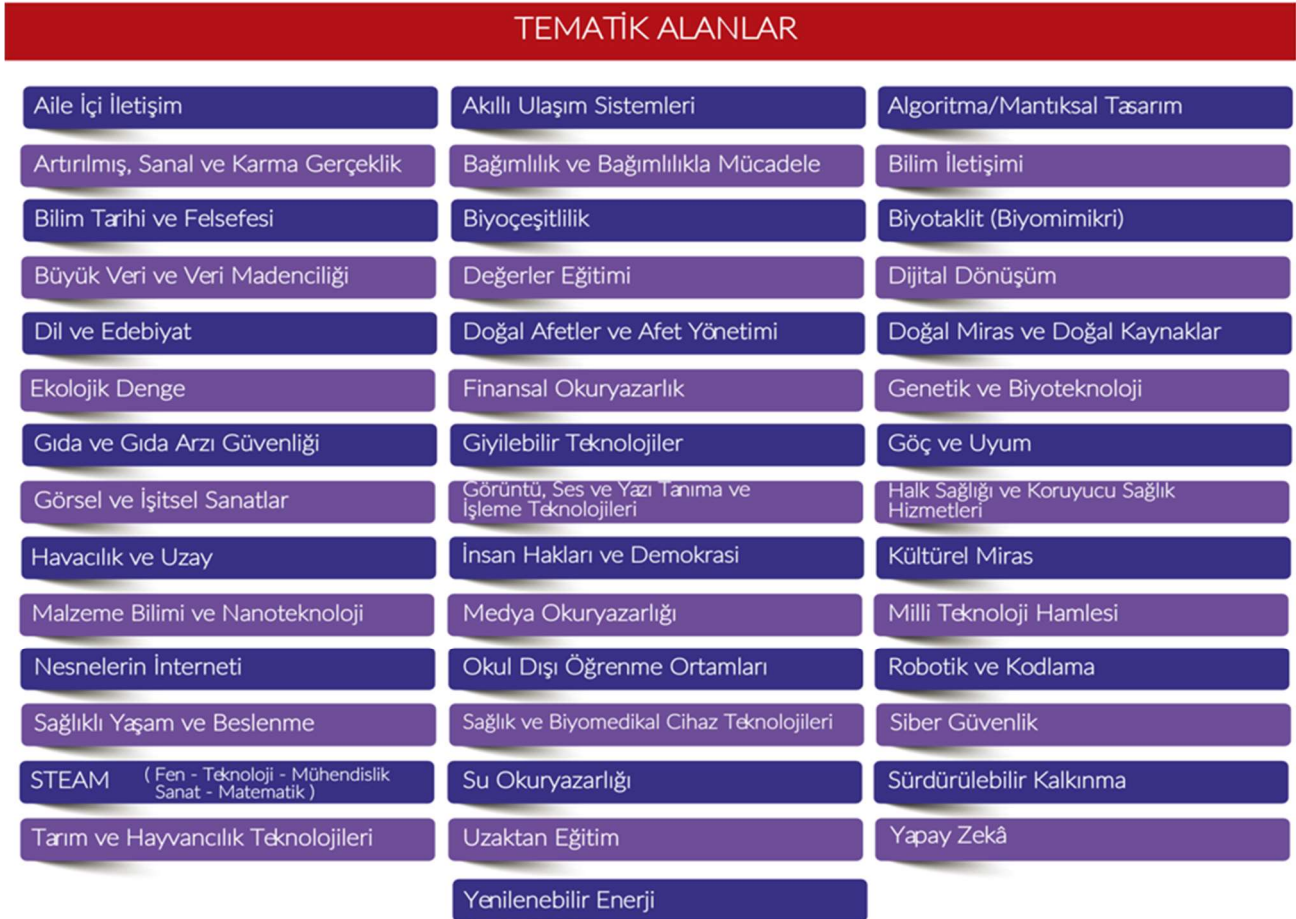
Şekil 3. Tematik Alanlar

Bu ana alanlarda yarışmaya başvuracak projelerin, aşağıda isimleri verilen tematik alanlardan birini kapsayacak şekilde hazırlanmış olması gerekir (Şekil 3).