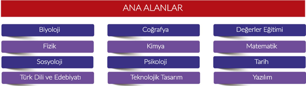
Şekil 2. Ana Alanlar

Yarışma, 12 ana alanda düzenlenmektedir (Şekil 2).